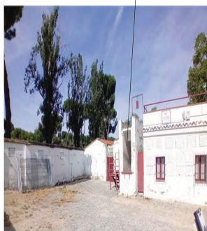
ED01 (vivienda mayoral)